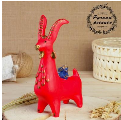
Рис.6 «Козлик с птичкой»

Свистульки изготавливаются вручную из глины, мастера лепят их и придают деталей с помощью стеков. Когда получилась нужная форма — фигурку просушивают и обжигают в печи. После наносят рисунок эмалевыми и масляными красками.(рис. 6, 7, 8)