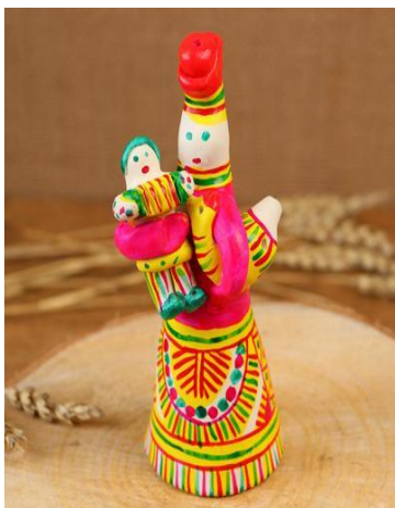
Рис.10 «Барыня с ребёнком»

Формы игрушек — животные и люди. Из животных самые частые изделия — в виде лошади, коровы и оленя. (рис. 10, 11, 12)