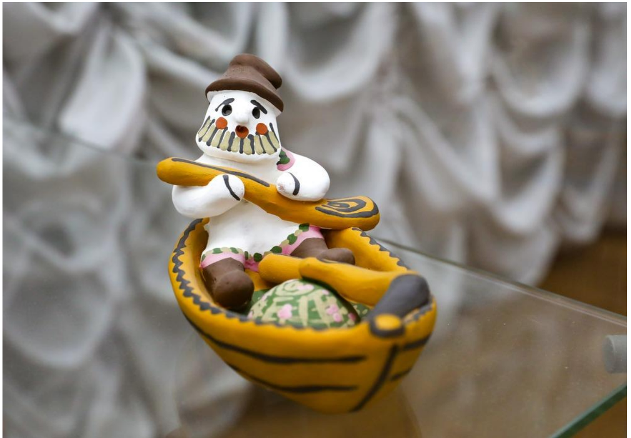
Рис.13 Каргопольская игрушка

Мастера поначалу никак не использовали игрушки. Умельцы лепили посуду, а из остатков глины делали фигурки. Их, как и филимоновские игрушки, просто так раздавали детям. Малышам они нравились, поэтому позже находчивые продавцы стали расписывать свистульки и применять их как рекламу — привлекали яркими игрушками детей, а когда они приводили родителей за покупкой, предлагали взрослым ещё и горшки.