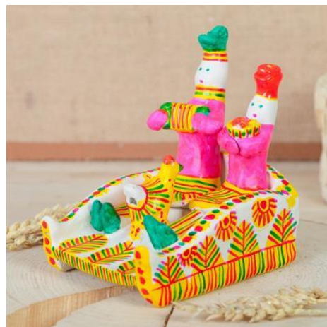
Рис.12 «Парочка на снях»