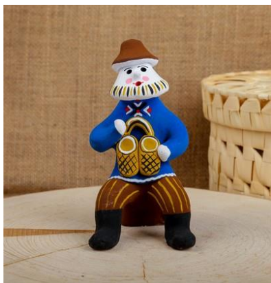
Рис.14 «Мужик с лаптями»