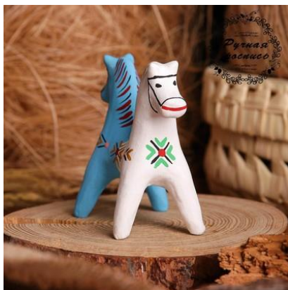
Рис.15 «Тяни толкай»