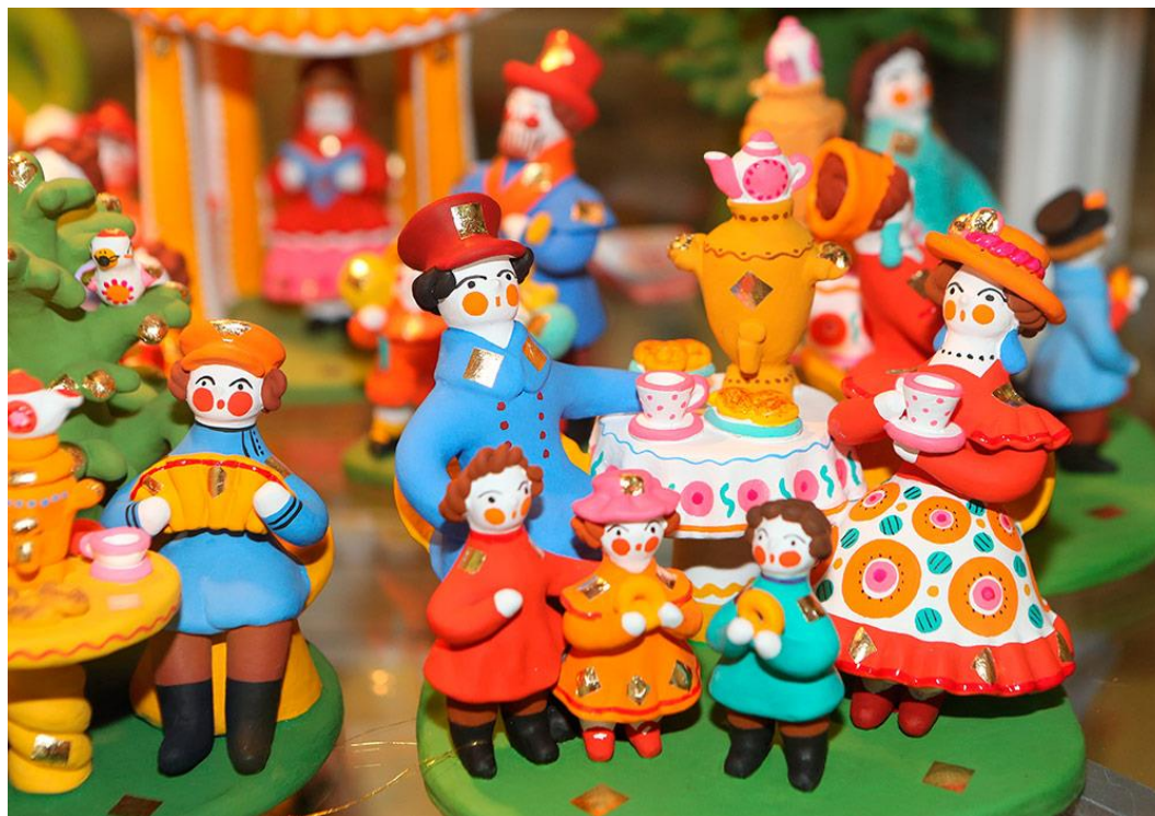
Рис.1 Дымковская игрушка

Первое упоминание этого народного промысла датируется 1811 годом. В те времена игрушки, которые лепили женщины слободы Дымково (рис.1), были атрибутом самобытного праздника Вятская свистунья.