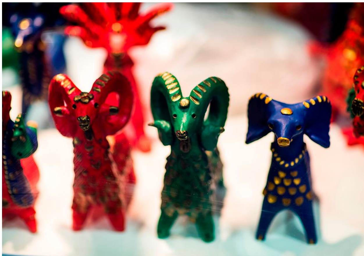
Рис.5 Абашевская игрушка

Отличительная особенность данной игрушки — неожиданные сочетания ярких цветов. Мастера превращают зверей в сказочных необычных персонажей, которые нравятся детям и взрослым (рис.5).