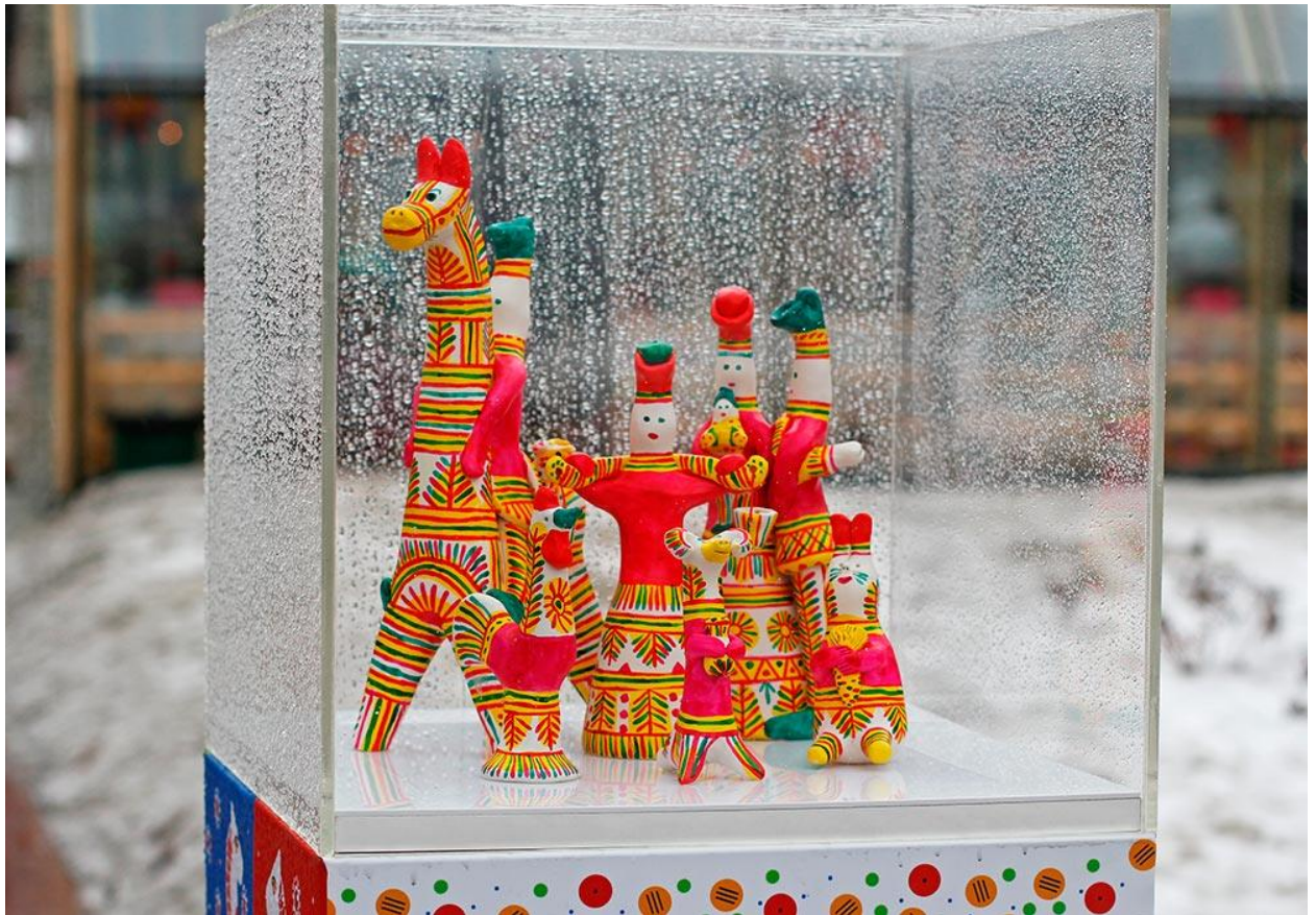
Рис.9 Филимоновская игрушка

Изготовление игрушек — свистулек — было женской работой. В основном этим занимались бабушки и обучали ремеслу своих внучек. Деньги, которые девочки получали за свои труды, откладывали и копили на приданое.