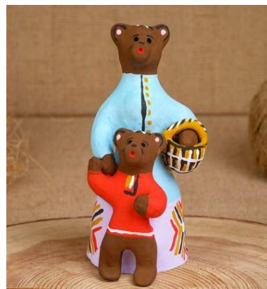
Рис.16 «Медведица с медвежонком»