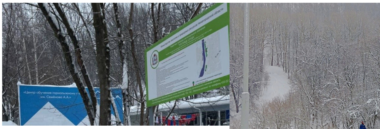
Фотографии 5, 6. Центр обучения горнолыжному спорту на Слуде имени А.А Семенова

Кроме того внизу лестницы есть центр обучения горнолыжному спорту на Слуде имени А.А Семенова (на карте помечен ★).