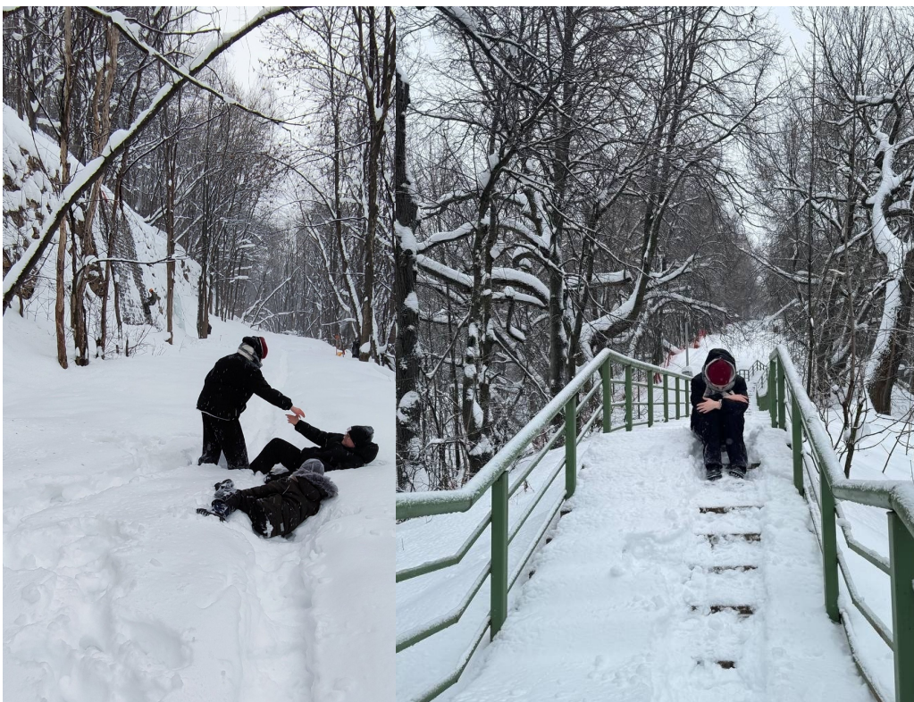
Фотография 10. Урочище Слуда. Фотография 11. Лестница.

Хочу заметить, что у этого маршрута есть минусы: место уникальное, но там совсем не чистят, лестница вся в снегу и по ней было сложно подниматься и спускаться. Дорога, помеченная синим на карте, более менее чистая, а вот дорога, помеченная коричневым, завалена снегом по колено.