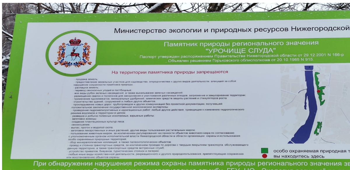
Фотография 4. Стенд министерства экологии и природных ресурсов Нижегородской области.

Кроме того внизу лестницы есть центр обучения горнолыжному спорту на Слуде имени А.А Семенова (на карте помечен ★).