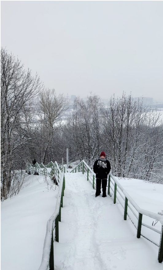
Фотография 3. Лестница.