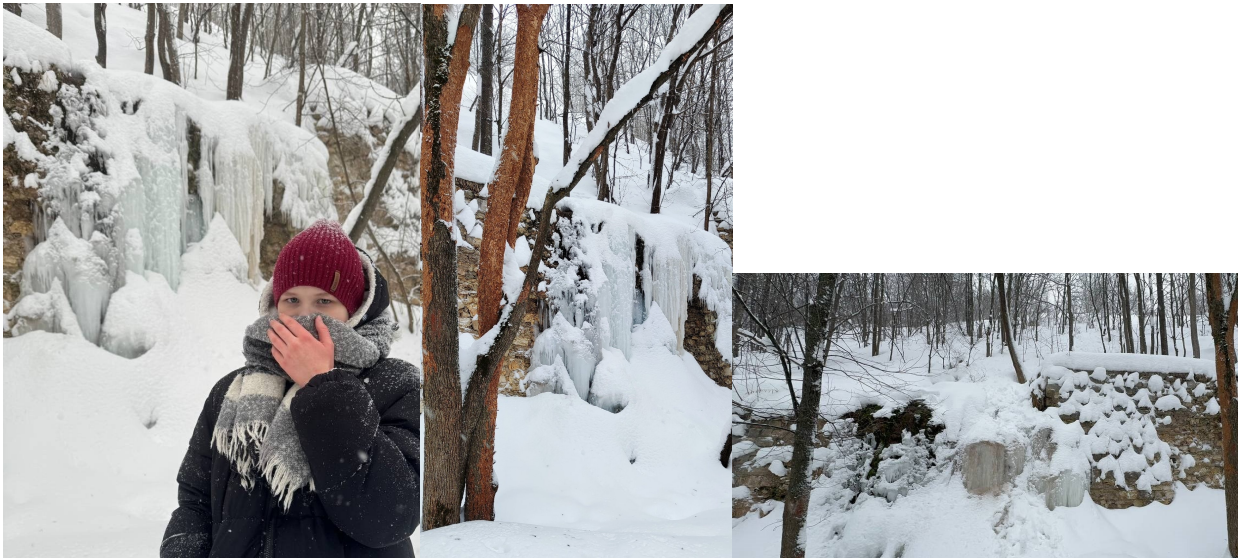
Фотографии 7,8,9. Урочище Слуда.

Хочу заметить, что у этого маршрута есть минусы: место уникальное, но там совсем не чистят, лестница вся в снегу и по ней было сложно подниматься и спускаться. Дорога, помеченная синим на карте, более менее чистая, а вот дорога, помеченная коричневым, завалена снегом по колено.