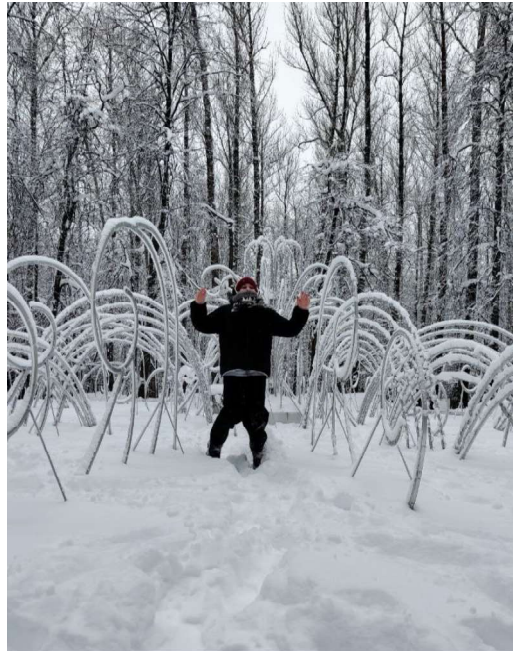
Фотография 1. Вход в «Швейцарию». Фотография 2. Фонтан.