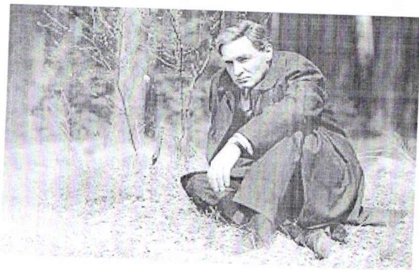
Рис. 3 Музыка к к/ф «Семнадцать мгновений весны». М. Таривердиев