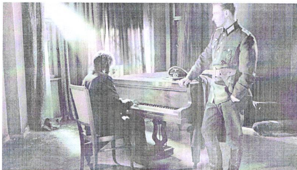
Рис. 5. Ф. Шопен Баллада №1. Фильм «Пианист» Р. Полански

Фильм «Пианист» – эпизод внутрикадровой музыки, когда еврейский пианист прячется от фашистов и его находит в запустелом разрушенном доме немецкий офицер. Он может его убить или отправить в концлагерь, но узнав, что тот пианист, заставляет его играть. Момент, когда главный герой фильма садится за рояль и дрожащими пальцами под страхом смерти играет Балладу №1 Ф. Шопена усиливает напряженность момента, мы понимаем, что пианист играет, как бы в последний раз в своей жизни, думая, что перед смертью. Музыка Шопена здесь подходит как нельзя лучше, для осознания трагичности данной ситуации. (Рис. 5)