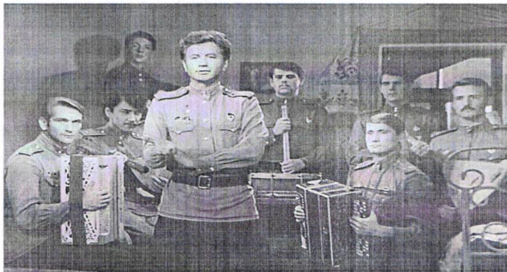
Рис. 2 «Смуглянка» из к/ф «В бой идут одни старики»

Песня «Смуглянка» из фильма «В бой идут одни старики», без которой невозможно представить ни один День Победы, и благодаря которой в массовое сознание был внедрён несуществующий образ молдавского партизана, была написана в предвоенное время и посвящена героической деятельности Григория Ивановича Котовского в годы Гражданской войны. В 1940 году Политуправление Киевского Особого военного округа заказало ряд музыкальных произведений для своего ансамбля песни и пляски, в результате чего Шведовым и Новиковым была написана сюита в честь Г. И. Котовского, в которую входило 7 песен, одной из которых и была ставшая позже знаменитой «Смуглянка». Так, благодаря поэту Якову Шведову и композитору Анатолию Новикову, увидело свет произведение, прошедшее сложный и тернистый путь к всеобщему признанию. (Рис. 2)