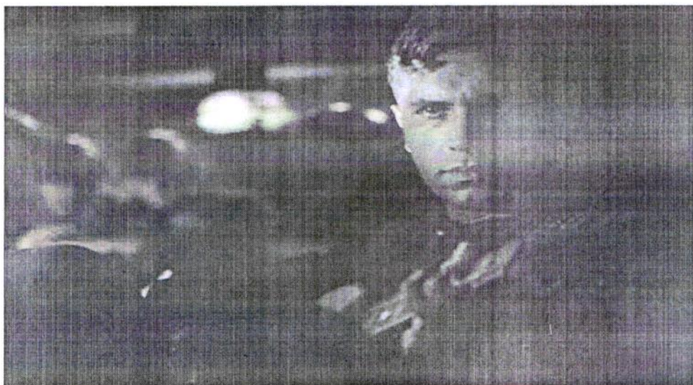
Рис. 1 Песня «Темная ночь» их к/ф «Два товарища», исполняет Марк Бернес

Песня «Смуглянка» из фильма «В бой идут одни старики», без которой невозможно представить ни один День Победы, и благодаря которой в массовое сознание был внедрён несуществующий образ молдавского партизана, была написана в предвоенное время и посвящена героической деятельности Григория Ивановича Котовского в годы Гражданской войны. В 1940 году Политуправление Киевского Особого военного округа заказало ряд музыкальных произведений для своего ансамбля песни и пляски, в результате чего Шведовым и Новиковым была написана сюита в честь Г. И. Котовского, в которую входило 7 песен, одной из которых и была ставшая позже знаменитой «Смуглянка». Так, благодаря поэту Якову Шведову и композитору Анатолию Новикову, увидело свет произведение, прошедшее сложный и тернистый путь к всеобщему признанию. (Рис. 2)