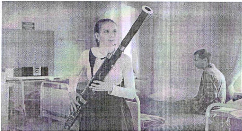
Рис. 7 «Фагот» 2023 г.

зашевелились от звуков фагота. Очень трогательный финал фильма, главная идея, которого – верить и не сдаваться. Девочка теряет отца, но не теряет веру. И именно музыка является той связующей нитью между отцом и дочерью, которая помогает им обрести друг друга. Она не только о войне на линии фронта, она о войне, которая за тысячи километров от нее – среди нас, за наши умы и души, за наше будущее. Картину рекомендовали к показу в старших классах школ. В фильме используется музыка И.С. Баха и С.В. Рахманинова (Рис. 7).