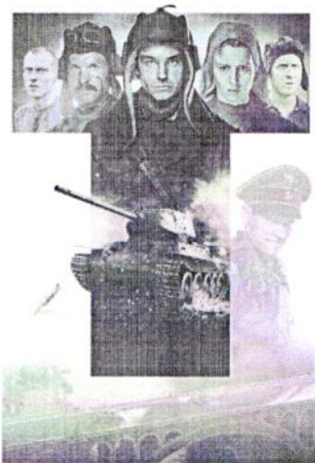
Рис. 8 Фильм «Т-34» 2019 г.

Два фрагмента из этого фильма очень впечатлили меня и побудили сделать этот проект. (Рис. 8)