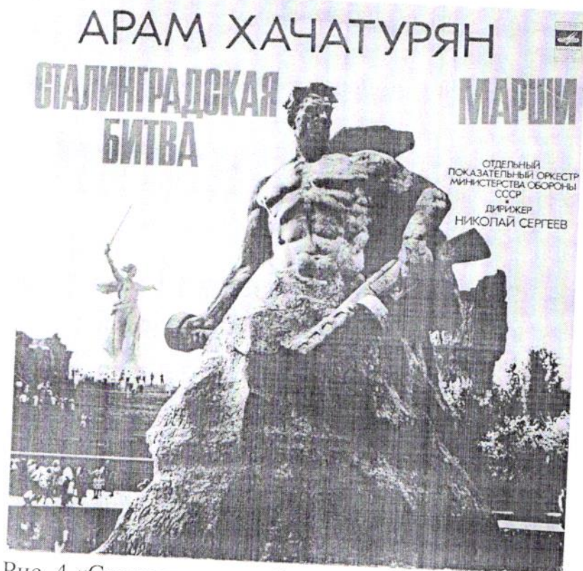
Рис. 4 «Сталинградская битва». А. Хачатурян 1949 г.

В результате Хачатурян написал музыку к большому двухсерийному фильму «Сталинградская битва», поставленному режиссером Владимиром Петровым. А затем это музыка была им переработана в программную симфоническую сюиту «Сталинградская битва», запечатлевшую героическую эпопею борьбы и победы Советской Армии. (Рис. 4)